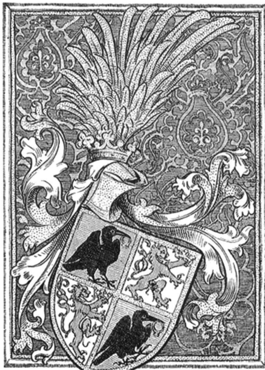
Hunyadi János címere (1453)

A továbbiakban István szabódik, s kéri az urakat: kérdenék meg a leányzót, hogy óhajtja-e őt „édes társul szerelemben”. Ugyanígy szabódik a leányka is, bár fontolgtatásának háttérében más szempontok is felbukkannak, elég gyakorlatias gondolkodásra utalók: „Dicső hősnek ölelése neki is csak öröm lesz-e?” Miután azonban arra is rájön, hogy István „úri nemzet ivadéka”, igent mond. István erre megizente, hogy „gazdag úri estebédre” meg fogja látogatni. Az úri esti vizit lebonyolódván, miután minden vitéz „nyugovóul puha ágyat” talált magának, ez történt Lázár fiával is: