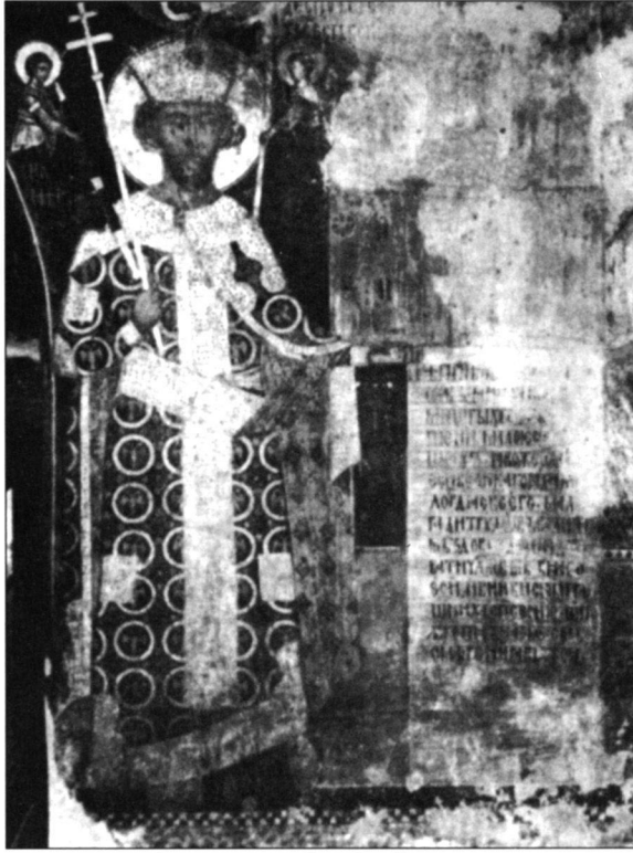
Lazarevics István despota, Sibinjanin Janko apja a származáslegendák szerint

Jankónak társaságában harcolván a török ellen, szinte egyik legelőkelőbb személye a szerb hősköltészetnek.” 21