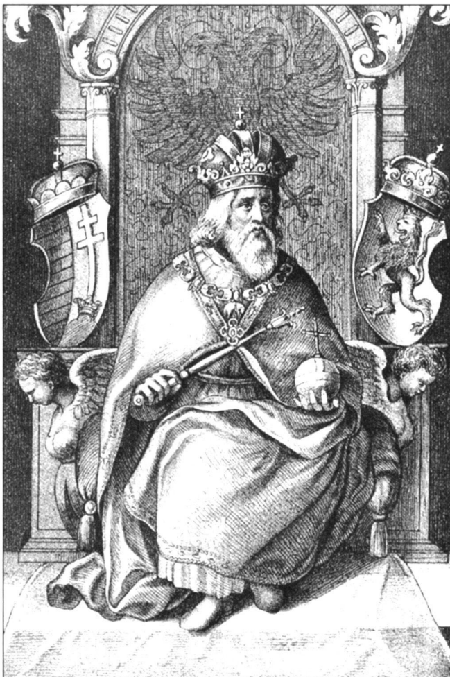
Zsigmond király, Hunyadi János apja a származáslegenda szerint

„Mondanak az inasok: hogy szép személyeket láttanak volna, kiváltképpen egy igen szép leánt láttanak volna, egy gazdag bojérnál, kinek mássa nem volna messze földön. Zsigmond király érette bocsát az inassokat. Mikoron elhozták volna a leánt és a királlyal szömbbe állana estve, monda a királynak: Felséges uram! Én nemes leán vagyok, az Morzsinai nemzetből való. Ha velem közessülni akarsz, együld megterhessülek tőled: mint lönne annakutánna magamnak és az én magzatomnak dolga? Erre legyen Felségednek először fő gondja...”