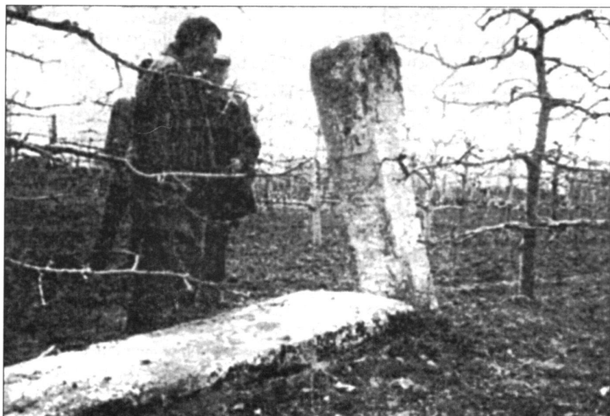
Hunyadi János/Sibinjanin Janko „sírja” a šumadijai Topolán (a helyi hagyományok szerint)